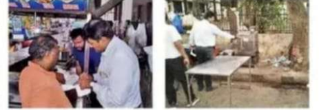
પાલિકાની ટીમે છૂટક વેપારીઓને દંડ ફટકારી જાગૃત કર્યા હતા.

સ્વચ્છતા સર્વેક્ષણમાં અગ્ર સ્થાને આવવા પાલિકાએ સ્વચ્છતા સુંબેશ સાથે પ્રતિબંધિત પ્લાસ્ટિક અંગે પણ સુંબેશ શરૂ કરી છે. દિવ્ય ભાસ્કરે ટીમની કાર્યવાહી સ્થળ પર નિહાળી હતી. અઠવાની ટીમે ધોડદોડ, અઠવાલાઈન્સના ઓનરિક રોડ પર ફરી જાગૃતિ આપવા સાથે દંડનીય કાર્યવાહી કરી હતી. એક સ્ટોર ખાતે તપાસ કરી તો થેલી પર 75 માઈક્રોન છપાયેલું હતું પરંતુ કોઈ સરકારી સિમ્બોલ ન હતો. જેથી તેમના